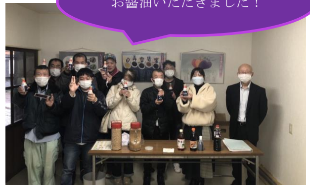
お醤油いただきました!

もみじ園では寒い中だったが散策をしてくれた。途中にあるほたる焼きも買うことが出来喜んでいた。