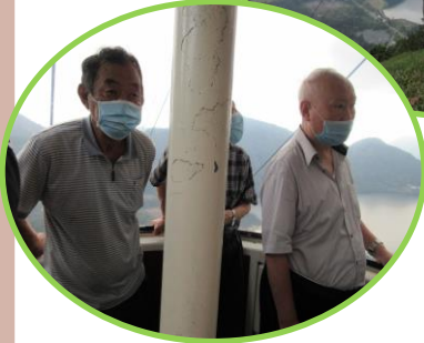
←ロープウェイの中にて

「空はあかね色」 さとう きさく(作) R5、8、30(水) 長岡「虹」にて 空はあかね色 空はあかね色 陽がしずむ 空があかね色になる 夕やけ雲 昼間カンカン照りの太陽 1日中大地をてらし 空の上に大地をおおう しかし しずむときは あかね色の雲をのこして 空を夕やけに 太陽は明日の日の出にまわる 朝日もまた 空はあかね色 いわゆる朝やけ 空はまっかっか 非常に空が うらやましくなる時でもある 空はあかね色 空はあかね色