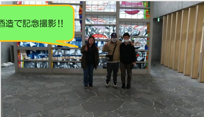
朝日酒造で記念撮影!!