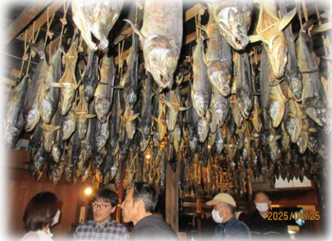
村上の塩引き鮭↑ 千年鮭「きっかわ」