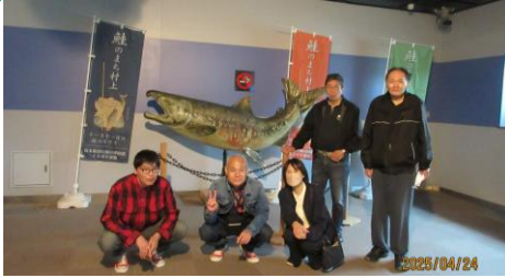
↑イヨボヤ会館にて