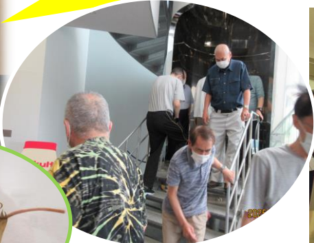
エアシャワー 体験中→