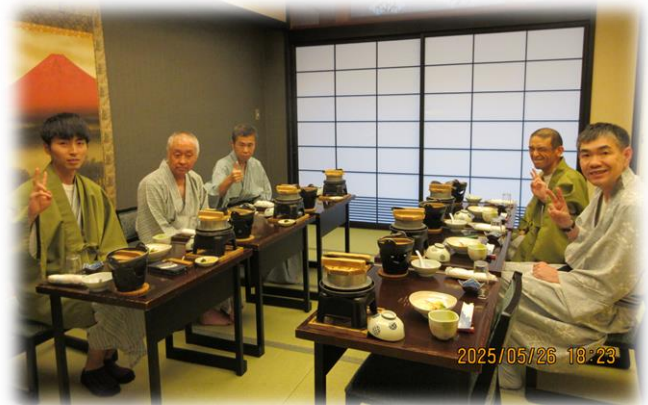
美味しい料理に、みんないい笑顔です!

2日目は「松川遊覧船」に乗り、松川の歴史を勉強しました。その後、「富山市科学博物館」で科学の不思議を体験しました。お昼は、富山駅構内にある「きときと市場とやマルシェ」でおいしいランチを食べました。