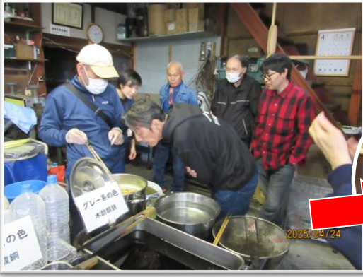
どんな色に染まるかな？ 染色中！