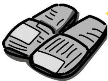
そなえ館でスリッパと雨具を作りました!!