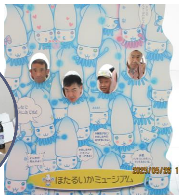
ほたるいかミュージアムにて↑