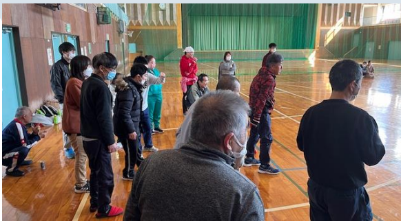
コスモス在籍者数 令和6年2月29日現在