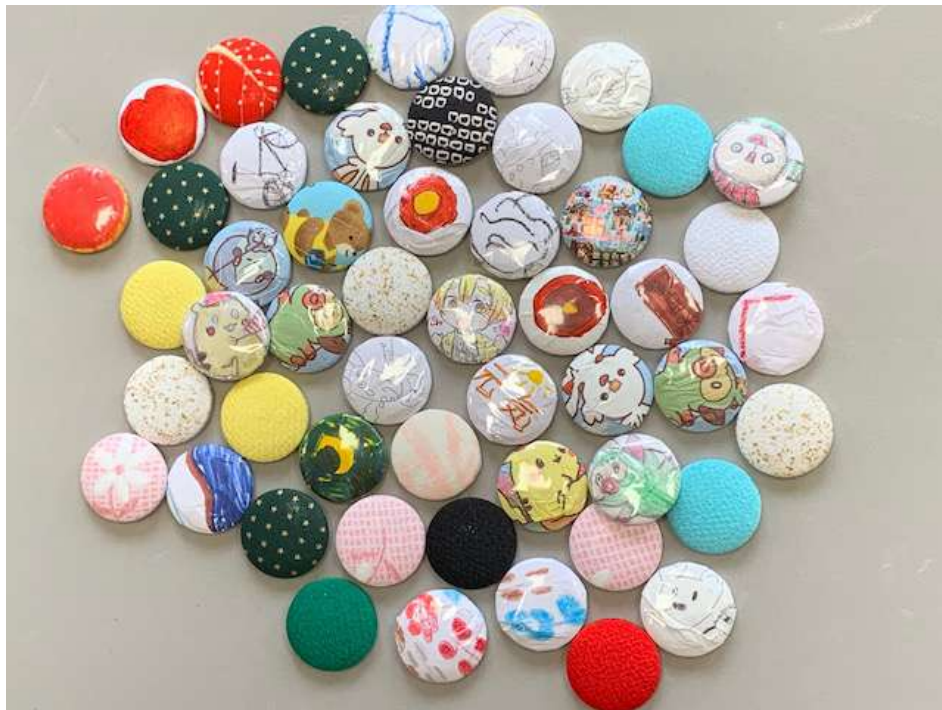
写真：コスモス 休日開所（くるみボタンで缶バッジを作りました！）