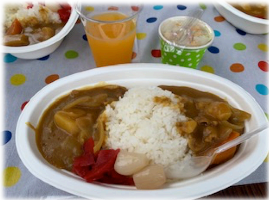
写真：メンタル祭り カレーライス