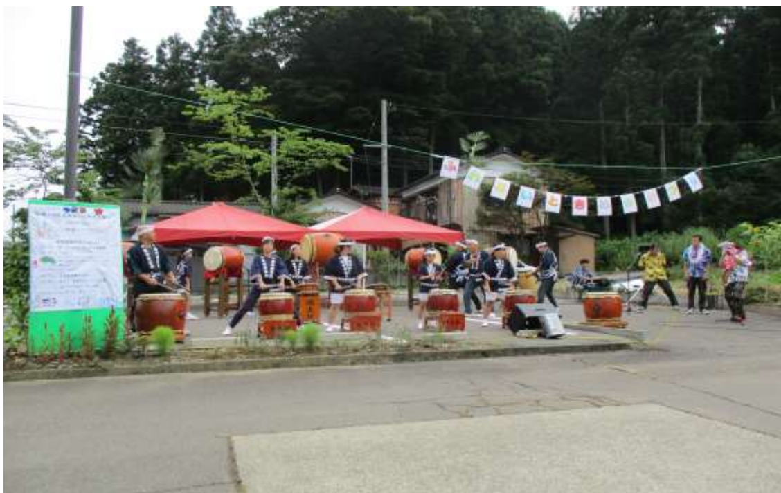
写真：コスモス ふれあいときめき祭り