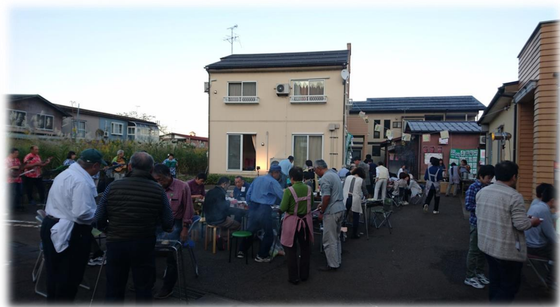
10月15日に開催された、めんたる祭の様子