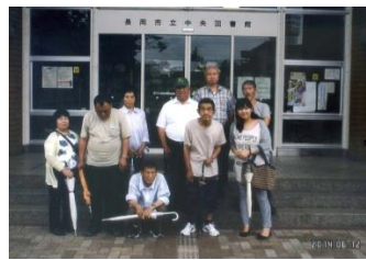
中央図書館前にて