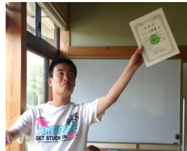
入賞やった～ \ (^ ^) /