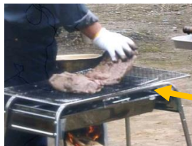
本当に大きなお肉・・・！