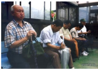
バスを待つメンバー

その後、近くにある「さんしち」でラーメンを食べました。 帰りは駅ビルに立ち寄りサンキや百円均一で買い物される方もいました。